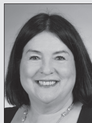
DENISE VILLENEUVE CENTRE RÉCRÉATIF BIBLIOTHÈQUE CENTENAIRE ÂGE D'OR COMM. SCOLAIRE COMMUNAUTAIRE ET CULTUREL